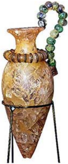
Rhyton : vase rituel en cristal de roche trouvé à Zakros

Visite du Musée archéologique de Sitia . Le musée renferme des vestiges venant pour la plus grande partie du site de Kato Zakros, le quatrième des palais minoens de l'île. Puis visite du site archéologique de Paleokastro . Coincé entre les champs d'oliviers et la jolie plage de Chiona, le site révèle les fondations d'une ancienne ville minoenne qui aurait rayonné sur la région à la période post-minoenne (environ 1700 av. J.-C.), mais dont certaines tombes retrouvées attestent d'une occupation humaine lors des première et deuxième périodes minoennes.