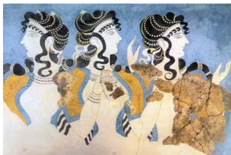
musée archéologique d'Héraklion

Le Musée archéologique d'Archanes contient des éléments retrouvés dans les sites antiques situés à proximité de la ville d'Archanes, le palais d'époque minoenne, la nécropole de la colline de Fourni et le temple d'Anemóspilia.